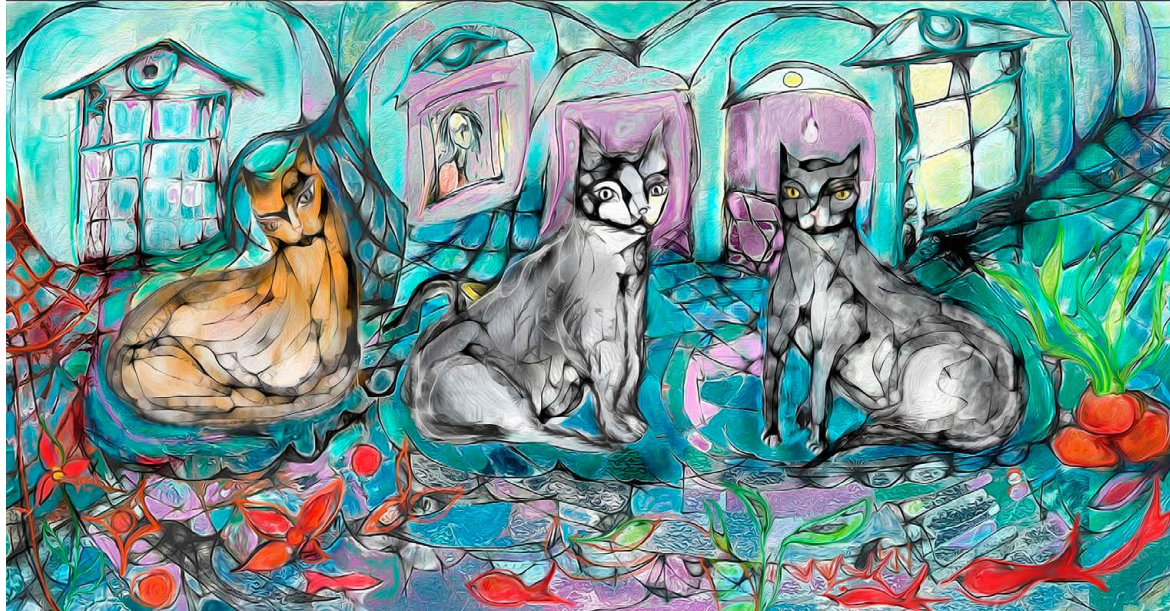
© Malú Méndez Lavielle. Acuáticos .

Los estudios cuyos resultados estamos relatando se hacen dentro de unas condiciones que distan galaxias de lo que se considera una lectura relajada y placentera: dentro de un ruidoso tubo de resonancia magnética, en el que los sujetos deben estar prácticamente inmóviles, donde deben leer lo que se refleja, a partir de una pantalla, en un espejo, y tienen que tocar un botón para pasar a la siguiente página. Claro que los investigadores de estos temas resultan ser unos optimistas incurables, y consideran que todo esto tiene un lado positivo, ya que pone en evidencia que la lectura está siempre mediada por algún tipo de soporte (papel, pantalla) y que puede llevarse a cabo en el transporte público, en una sala de lectura o en el sofá de tu casa, pero también en un laboratorio.