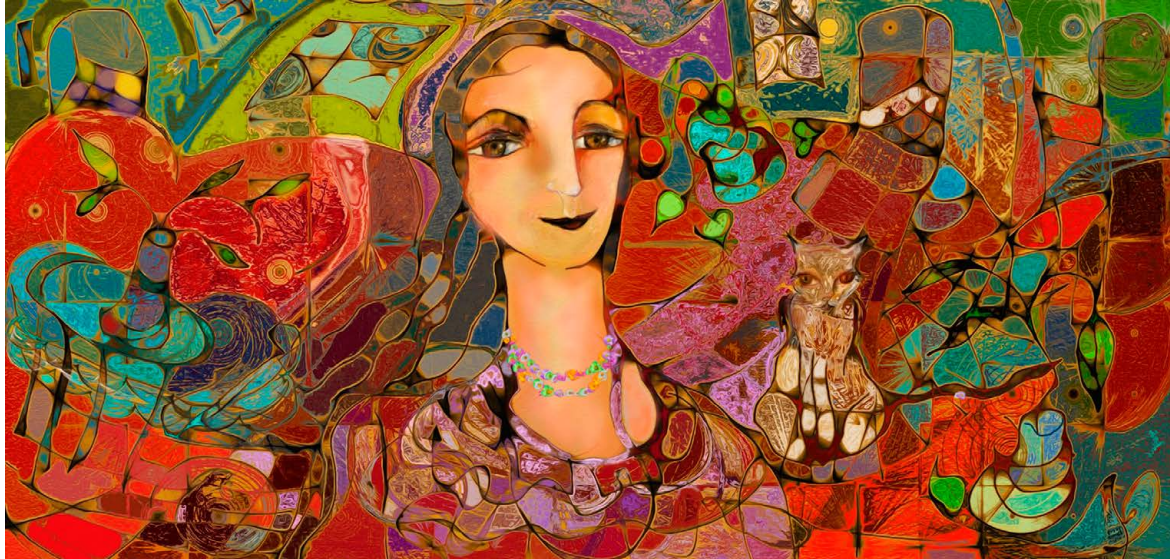
© Malú Méndez Lavielle. Buena compañía .

contextos y fines de lectura encuentra su correlato en la plasticidad del cerebro. Y si la práctica es plural y el cerebro es plástico, entonces la tarea científica y educativa es doble: ampliar oportunidades de lectura desde la infancia y comprender, con herramientas cada vez más precisas, cómo distintas maneras de leer abren distintos caminos para pensar.