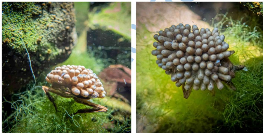
Figura 4. Machos de chinche de agua Abedus ovatus con cuidado parental prolongado con huevos cercanos a la eclosión.

Encontramos que los machos que cargaban huevos tenían tasas de supervivencia más bajas que los machos no parentales, confirmando que existe un costo de supervivencia asociado al cuidado paternal. Esto podría deberse a varios factores: la pérdida de la hidrodinámica por cargar la puesta genera una resistencia extra a la corriente de agua, lo que dificulta su movimiento para capturar presas o escapar de depredadores. Por otro lado, el aumento en el gasto energético por realizar brood pumping podría deteriorar su condición y aumentar su mortalidad. Y finalmente, la exposición a depredadores tanto en el agua como fuera de ella (Argaez y Munguía-Steyer, 2023).