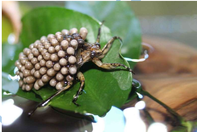
Figura 1. Chinche de agua macho Abedus ovatus (Belostomatidae) con puesta de huevos en su espalda. Los machos cargan los huevos desde la puesta hasta la eclosión.

En los ríos de Chignahuapan, en el norte de Puebla, un insecto oscuro se confunde entre las rocas. Sobre su espalda carga algo más que su propio peso: decenas de huevos ovalados y grisáceos adheridos con precisión. Se trata de una chinche de agua macho, y su vida, por ahora, gira en torno a esos huevos (Figura 1).