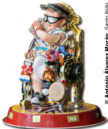
© Antonio Álvarez Morán. Santo Niño Turista, 2012.