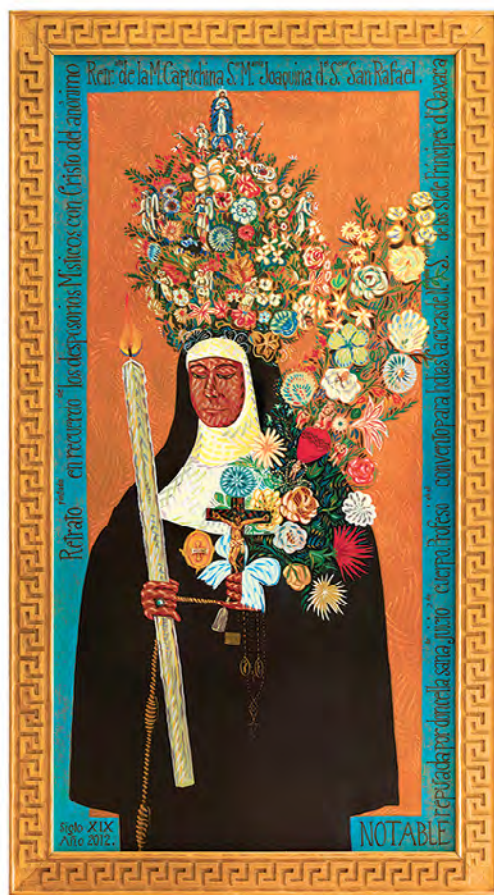
© Antonio Álvarez Morán. Retrato del retrato de Sor Joaquina del Señor San Rafael, 2012.

Pensar en la vida conventual, lejos de ser una monotonía para Antonio y un pasar a viento suave, es un hervidero de tormentas en donde el arte se hace presente a