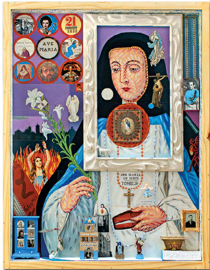
© Antonio Álvarez Morán. Retrato-territorio del Lirio de Puebla, 2013.

¿Qué ocurriría si un retrato, además de presentarnos la figura de un personaje, nos mostrara su historia y su entorno? Tendríamos una obra que más allá de plasmar la esencia estética del individuo retratado, expone y manifiesta su biografía, resultando así en verdaderas reseñas históricas en forma de retratos-territorio . Álvarez Morán consolida esta técnica como ícono de sus historias de monjas que resulta única en Puebla, y quizá en todo México.