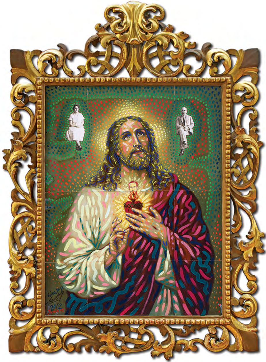
© Antonio Álvarez Morán. Sagrado Corazón Álvarez Golzarri, 2012.