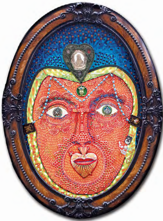
© Antonio Álvarez Morán. Sor Marta Antonia Josefa de la Velocidad de la Luz , 2015.