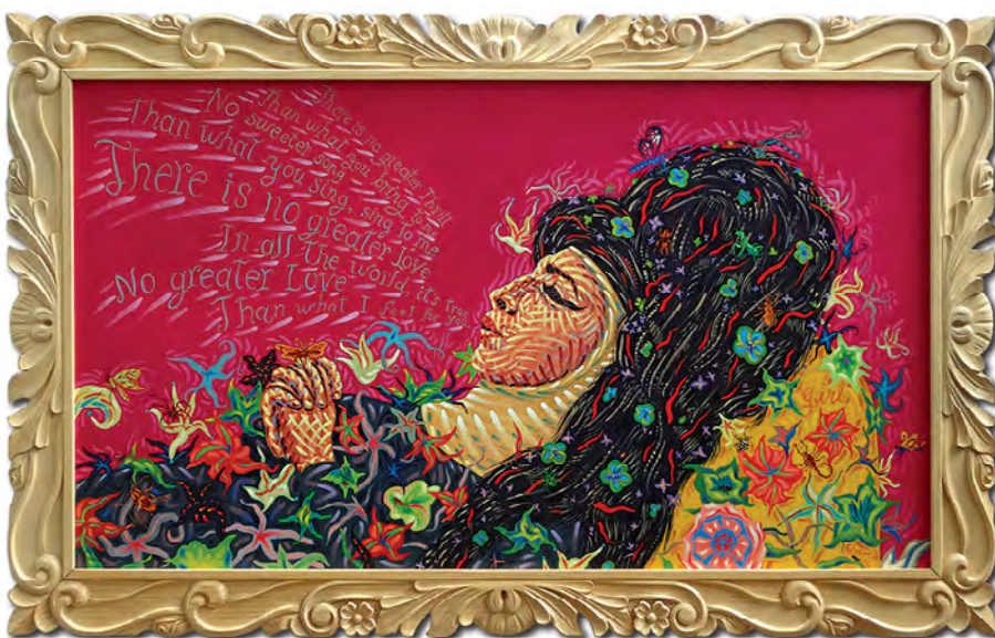
© Antonio Álvarez Morán. Retrato de la venerable hermana Amy Winehouse , 2014.

En el retrato se puede expresar la atracción por la figura y el personaje representado. El retrato es capaz de captar la esencia del individuo, convierte a la figura en un ser animado. Veo a las monjas retratadas como seres vivos –acierta el artista–.