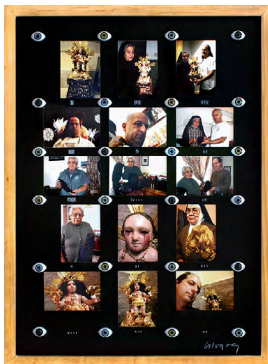
Crónica capilar, 2010.