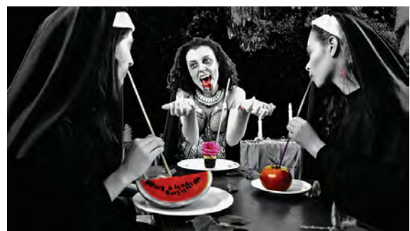
© Antonio Álvarez Morán. Fotografía de Las monjas vampiras contra el hijo de Benito Juárez , 2016.

una serie de cortometrajes bajo el título de Los misterios de las monjas vampiras , que conjugan la ficción y el terror en un ambiente surrealista enmarcado en hechos históricos. Este proyecto, que comenzó a desarrollarse desde el 2016, ha arrojado ya el primer misterio de la serie: Las monjas vampiras contra el hijo de Benito Juárez , título que próximamente será presentado en la XIII Bienal del Congreso de la Asociación Gótica Internacional en la UDLAP de la Ciudad de Puebla.