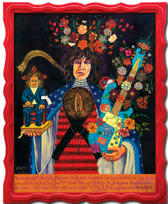
© Antonio Álvarez Morán. Retrato de Sor Patti Smith, 2011.

¿Es esta historia de monjas una historia terminada? Definitivamente no. Actualmente, los proyectos con la temática “monjística” han alcanzado el mundo cinematográfico con la creación de